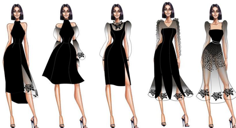
Рис. 2. Авторські ескізи колекції суконь в коктейльному стилі

В рамках дослідження було спроектовано та розроблено дизайн-проект колекції жіночих суконь у коктейльному стилі зі застосуванням характерних рис стилю з урахуванням модних тенденції та використанням в якості декоративного оздоблення вишивки тон в тон до основного матеріалу (рис. 2).