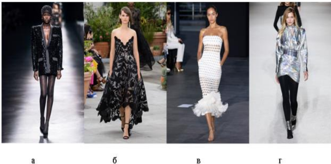
Рис.1. Тенденції коктейльних суконь в колекціях: а - Saint Laurent, A/W 2019/2020; б - Oscar de la Renta, S/S 2020; в - David Koma, S/S2019; г Balmain S/S 2019

Враховуючи сучасні тенденції можна виділити сім основних трендів суконь в коктейльному стилі: 1. коктейльна сукня асиметричного покрою (на одне плече або з одним рукавом); 2. сукня-жакет; 3. сукня-бюстье або корсет; 4. сукня з мережива (об'ємного 3D мережива та комбінації з контрастним нижнім шаром сукні); 5. сукня футляр; 6. сукня з бахромою (бахрома з ниток, пір'я або бісеру); 7. сукня в ретро стилі. В колористиці дизайнери пропонують враховувати сезонність при проектуванні коктейльних суконь. Так, осінь-зима – це насичені темні кольори: бордо, чорний, темно синій, смарагдовий, червоний; весна-літо – більш яскраві: білий, ніжно рожевий, голубий та інші. Художньо-конструктивними рішеннями сучасних суконь є прилеглі однотонні сукні, або сукні з розширеними спідницями з різноманітним оздобленням: розшиті бісером, паєтками та коштовним камінням; перевага надається тканинам з ефектом металік, з люрексом, сітчастим тканинам, трикотажу, оксамиту. Основними візуальними ефектами є прозорість та ефект оголеного тіла, а також сукні складного покрою (рис.1).