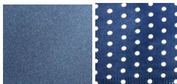
Рис. 3. Тканини-компаньйони для виготовлення сукні-жакету

Особливостями запропонованої моделі сукні-жакету напівприлеглого силуету з довгими двшовними вшивними рукавами та комбінованою застібкою є поєднання елементів класичного жіночого