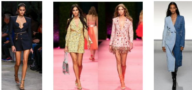
Рис. 1. Сукні-жакет з колекцій Versace, Saint Laurent та Givenchy

На основі аналізу модних тенденцій стосовно сучасних колекцій у діловому стилі та основних принципів їх створення [4] запропоновано модель сукні-жакету для жінок молодшої вікової групи, комбінованої з двох видів костюмної тканини (рис. 2). Для виробу підібрано тканини-компаньйони модних синіх відтінків, одна з яких – з актуальним принтом polka dots (рис. 3).