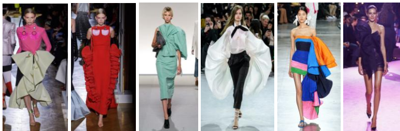
Рис. 1. Моделі суконь з об'ємними деталями з колекцій Valentino, Givenchy, Alexandre Vauthier, Schiaparelli сезону весна-літо 2020 р.

Почуття стилю – це вміння поєднувати здавалося б непоєднувані речі. Аналіз модних тенденцій на весну-літо 2020 р. дозволяє стверджувати про наявність контрастного поєднання об'ємних деталей з напівприлеглим силуетом виробу (рис. 1). Об'ємними можуть бути як основні деталі (рукава), так і декоративні (волани, банти, деталі оздоблення тощо). У тренді шовкові та атласні сукні, а також моделі з м'яких, ніжних, легких тканин, які дозволяють створювати об'єм [4].