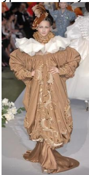
Рис. 4. John Galliano. Творча інтерпретація костюма П'єро commedia dell'arte . Колекція haute couture осінь/зима 2007–2008 рр.

«Множинне інтертекстуальне посилання» на commedia dell'arte , образ Арлекіна і полотна Пабло Пікассо «Арлекін, що схилився» (1901, Метрополітен-музей, Нью-Йорк) та «Арлекін музикант» (1924, Національна галерея мистецтв, Вашингтон, США) зустрічаємо у репрезентованій на Міланському тижні моди колекції Jeremy Scott бренду Moschino весна/літо 2020 р. Особливістю дизайнерської концепції є цитування, нові контекстуалізація та інтерпретація цілісного культурного образу та асоціативні перегуки з твором живопису.