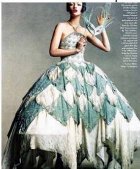
Рис. 1. John Galliano. Сукня з принтом, що асоціюється з костюмом Коломбіни. Колекція haute couture весна/літо 1998 р.

Характерне для постмодернізму «множинне інтертекстуальне посилання» на костюм Коломбіни, традиційне японське жіноче вбрання і стиль «New Look» зустрічаємо в колекції John Galliano haute couture весна/літо 2007 р.