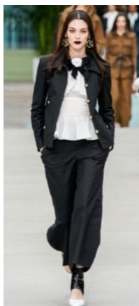
(Колекція будинку моди Chanel, 2020)