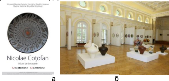
Рис. 1. Колекція керамічних виробів Н. Коцофана: а – постер, б - ювілейна виставка кераміста, Національний Музей Искусств, РМ

В связи с общими характеристиками времен существования культуры Кукутєнь-Трипольє, мы сначала попытались кратко проанализировать новый концептуальный подход к истории человечества, в том числе к древнейшему прошлому, традициям искусства, сформировавшемуся в двадцатом веке в Республіке Молдова. В настоящее время многие художники Молдови, дизайнеры, керамисты, архитекторы (члены СХ РМ) используют традиционные народные мотивы для создания своих творческих работ, несмотря на активные процессы глобализации и модернизации общества, внедрение инновационных технологий и современные тенденции в искусстве, стилистики модерн.