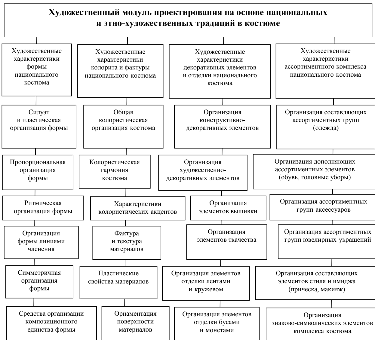
Рис. 1. Схема построения художественного модуля в формообразовании современной одежды на основе национальных этно-художественных традиций