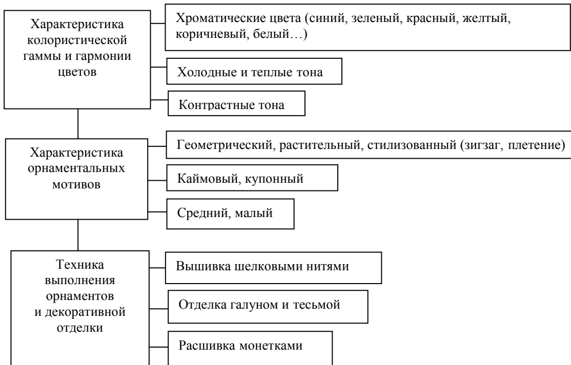
Рис. 2. Структурный анализ колористических характеристик и орнаментации национального костюма Ирана Fig. 2. Structural analysis of coloristic characteristics and figuration of a national suit of Iran

Геометрические мотивы в виде различных ромбов, прямоугольников, полукругов, полос и их комбинаций приобретают знаковость в схеме построения формы костюма и выделения его композиционно-психологического центра.