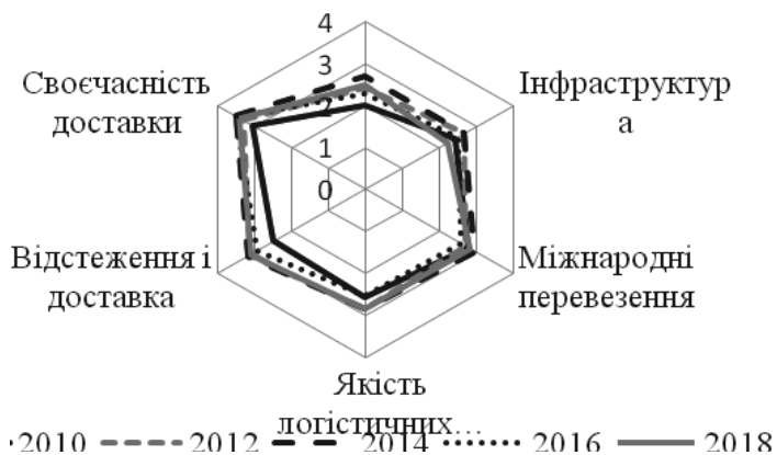
Рисунок 7.1. Значення LPI для України в розрізі окремих показників в 2010, 2012, 2014, 2016, 2018 рр. (побудовано автором на основі [2; 12])

Іншим показником, за яким Україна має низькі позиції, є якість транспорту та інформаційних технологій. У країнах з високим рівнем індексу цей показник у 2018 р. досягнув 4,37, тоді як в Україні є рівним 2,22 і знизився порівняно з 2016 р. майже на 11%. Крім того, в Україні є потреба адаптації логістичних послуг до світових стандартів, що дозволить сформувати на рівні країни ефективний ланцюг поставок.