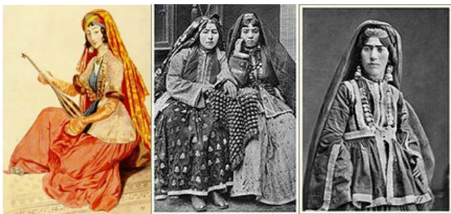
Рис. 1. Национальный женский костюм Азербайджана XIX-XX вв.

В работе поставлены задачи исследования особенностей дизайна, изучены структуры и строения келагаи на основе параметров строения ткани, как одного из элементов национального азербайджанского костюма, с целью сохранения национальных традиций и их применения в современной одежде.