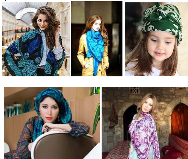
Рис. 4. Использование келагаи в современном костюме

Другим направлением стала разработка нетрадиционных вариантов ношения келагаи, предложенные дизайнером Илаой Зейналовой (рис. 4).