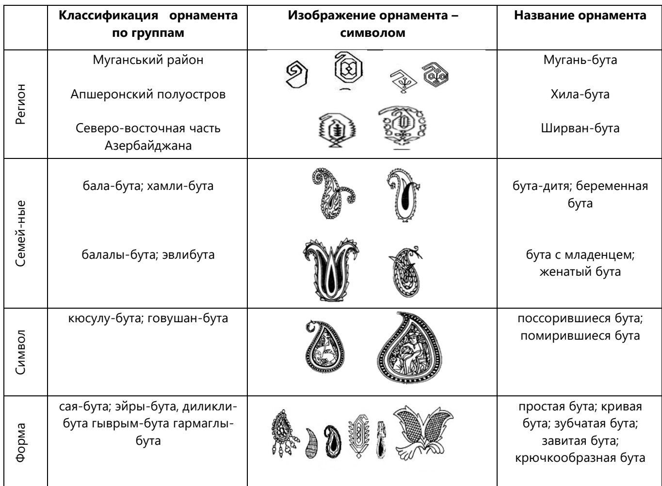
Таблица - Символика различных видов орнаментов

По размеру и цвету келагаи бывают разнообразными. Красный келагаи – показатель счастья и радости на свадьбах, черный и синий келагаи выражают боль и грусть. Обычно пожилые женщины использовали темные, а молодые женщины яркие цвета, а в последнее время, чаще используются белые келагаи. С сожалением нужно отметить, что некогда известные во всем мире шелковые келагаи почти вышли из быта азербайджанцев и стали историей.