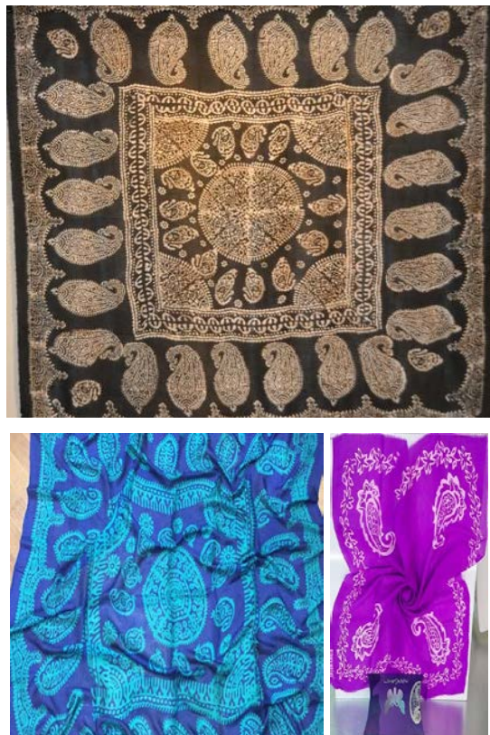
Рис. 2. Образцы платков келагаи

расположение основных и уточных нитей, связь и взаимодействие их между собой. Для получения требуемых свойств келагаи необходимо, чтобы нити в нем имели определенное расположение, и силы воздействия, которые состоят главным образом из сил трения и сил сцепления нитей.