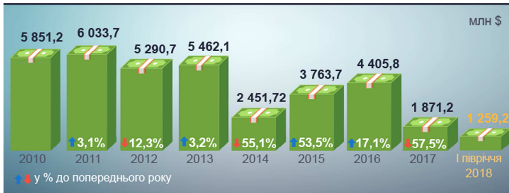
Рис. 3. Надходження прямих іноземних інвестицій в Україну у 2010-2018 рр.

становили у 2011 році – 6 033,7 млн дол. США. На сьогодні ситуації погіршилась, дані показники становлять 1 259,2 млн дол. США, що на 4774,5 млн дол. США менше.