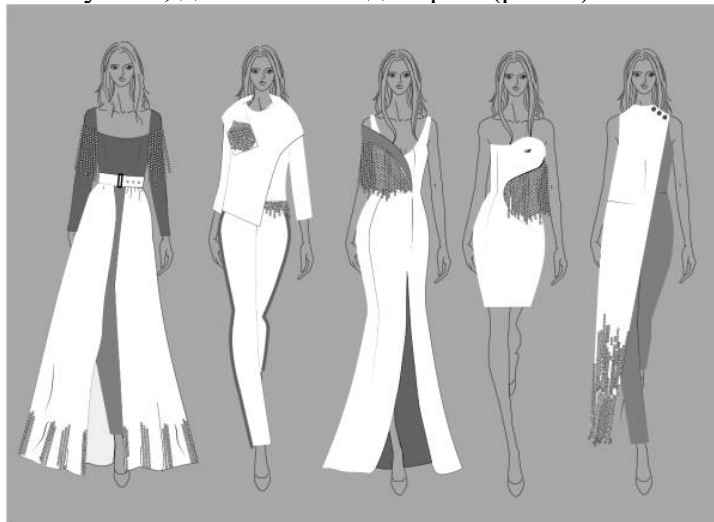
Рисунок 2 – Ескізи моделей колекції жіночого одягу

На основі проведеного аналізу розроблено колекцію жіночого одягу за допомогою суспільно-символічного та асоціативного зв'язку. Основною ідеєю колекції, її джерелом натхнення стала легенда «Як гуси врятували Рим». Стилiстичною основою колекції є запозичення від історичного костюму лицарів – обладунків: їх форми, елементів та технології з'єднання один з одним. Створена колекція об'єднана загальною ідеєю, емоційно-художньою виразністю образу, єдністю стилю, форми, кольоровим рішенням. В моделях колекції використано білий колір, а саме відтінок «Starwhite», який символізує колір гусей та сірий колір – «Sharkskin», який уособлює епоху Середньовіччя. До складу колекції входить такий асортиментний ряд виробів: штани, жакет, спідниця, комбінезони, сукні – різні за кроєм, проте поєднані силуетом, довжиною та декором (рис. 2).