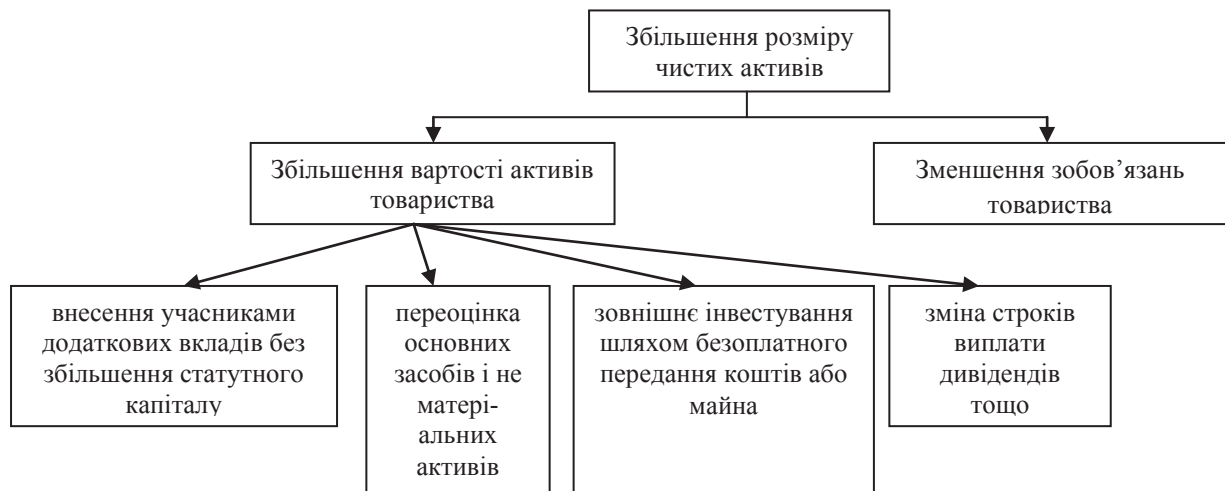
Рис. 2. Способи збільшення розміру чистих активів ТОВ «Сумського машинобудівного заводу»

Серед існуючих способів такого збільшення варто відзначити такі (рис. 2) [1].