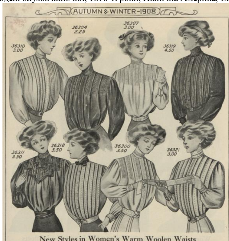
Рис. 3. Моделі блузок жіночих, популярних серед працюючих жінок, Північна Америка [6]

В 1900-1910-ті сформувався особливий стиль – стиль Гібсона. Блузки цього стилю мали доволі складні прикраси у вигляді вишивки або шнурування (елементів, характерних для нижньої білизни), а також складки, плісировки (рис. 4). Вони доволі швидко стали популярними як для денних зустрічей, так і у якості неофіційного одягу для вечора [2].