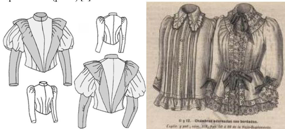
Рис. 2. Моделі блузок жіночих, 1890-ті роки, Північна Америка, Європа [5, 7]

Молоді робітниці надавали перевагу в одязі жакету, довгій спідниці і блузці. Модні видання починають пропонувати моделі блузок спеціально для працюючих жінок (рис. 2, 3). Блузки прямі, простого покрю, без оборок і оздоблень, стали популярними серед працюючих жінок наприкінці XIX – початку XX століть, оскільки вони були практичними і зручними. Вони виготовлялися на швейних підприємствах з використанням швейних машин і праці низько кваліфікованих робітників (рис.3) [6].