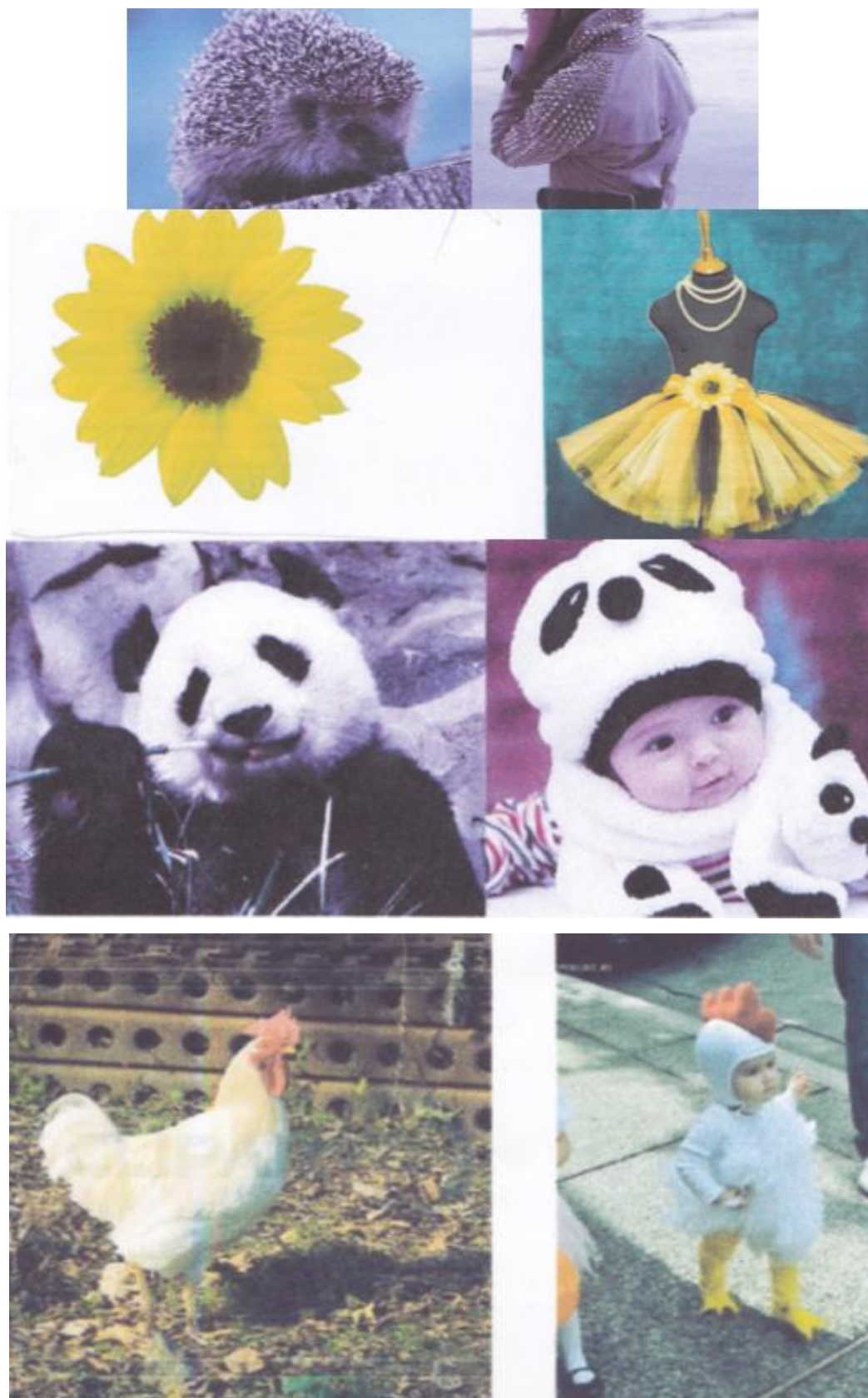
Рис. 2. Формоутворююча координація елементів структури біоаналога та костюма