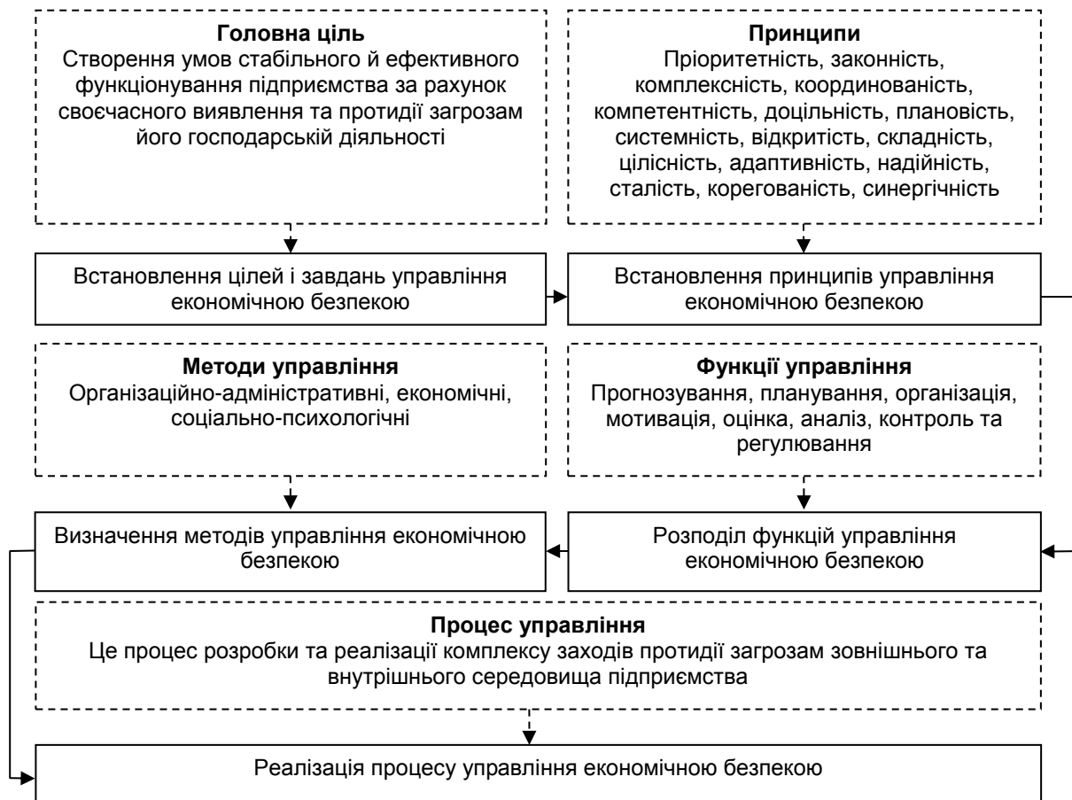
Рис. 1. Модель реалізації процесу управління економічною безпекою підприємства

результати дозволяють оцінити ефективність впровадження заходів передбачених стратегією безпечного розвитку.