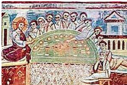
Рисунок 1 - Церква монастиря Сант-Анджело в Капуе.

Наукова новизна та практичне значення отриманих результатів. Проведення порівняльного аналізу перспективної побудови композиції відомих живописних полотен набуло подальшого розвитку для практичних вправ з оволодіння та засвоєння матеріалу з лінійної перспективи.