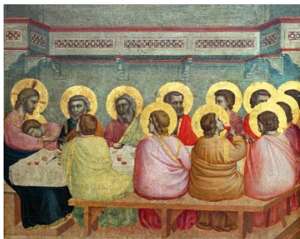
Рисунок 2 - Тадео Гадди, (1351-52 рр.)

Результати дослідження. Розвиток методів побудови перспективних зображень цікаво прослідкувати, порівнюючи картини художників початку другого тисячоріччя в історичному розвитку на прикладі одного з найпопулярнішого євангельського сюжету «Тайна вечеря».