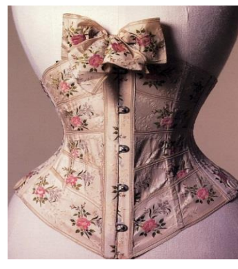
Рисунок 1 – Корсет епохи бароко

Корсет – від франц. Corps – тіло. Історія корсета починається в античні часи. Саме тоді під хітонами і туніками носили шкіряні пояси – стрічки на грудях або під грудьми, які підкреслювали красиву форму фігури. Змінюється ідеал жіночої фігури, змінюється і одяг. За цими змінами слідує зміна корсету. Але найсерйозніше ставлення до корсету з'явилося в період стилю бароко в іспанській моді XVI-XVII століття. Саме цей період сприймається як катування для тіла, оскільки корсет був панцирем, який його деформував (рис. 1). Але, незважаючи на це, такі корсети носили досить довго. В середині XVII століття приходить полегшення. Корсети роблять з м'яких тканин: шовк, сатин і атлас. Знову в моді підкреслені красиві і пишні груди та тонка талія. Це епоха рококо. І корсет також залишається основою дамського туалету (рис. 2) [1].