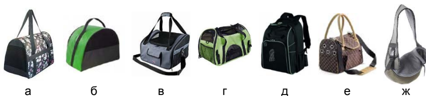
Рис. 2. Варіанти місць розташування вентиляційних отворів в сумках-переносках для собак

Ще одним чинником, який слід враховувати при проєктуванні сумок-переносок, є сезонність виробу. В теплу пору року собака не може перегріватись, і як наслідок, пакет матеріалів повинен мати високу повітропроникність, демісезонні сумки мають бути з утепленим дном із водонепроникним пакетом матеріалів, а зимові – морозостійкими та вітрозахисними, більші за об'ємом із-за наявності одягу на тварині.